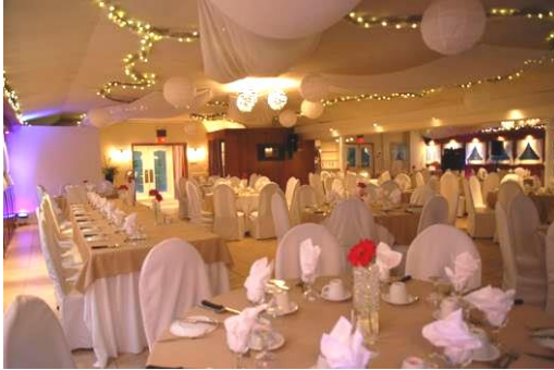
LA SAPINIÈRE (Capacité de 100 à 175 personnes)