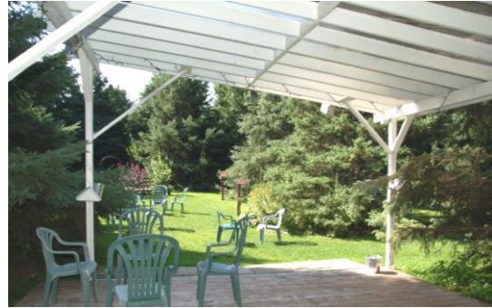
TERRASSE DE LA SAPINIÈRE