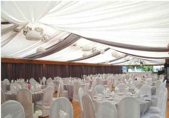
LA MARQUISE (Capacité de 125 à 250 personnes)